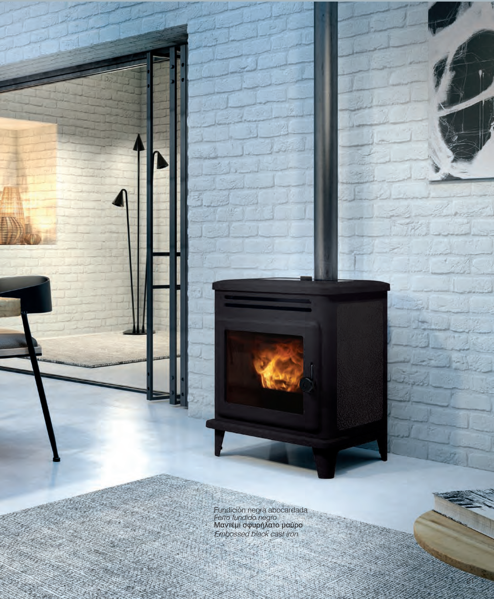
Fundición negra abocardada Ferro fundido negro Μαγτέμι σφυρήλατο μαύρο Embossed black cast iron