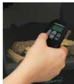
Mando a distancia