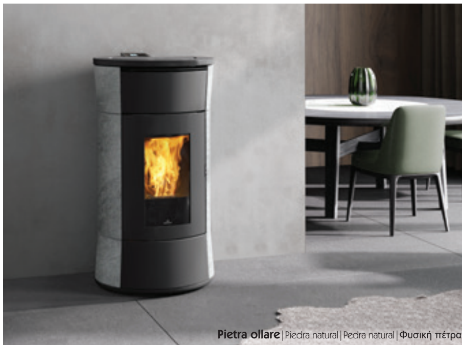
Pietra ollare | Piedra natural | Pedra natural | Φυσική πέτρα

IT Termostufa a pellet dal design “a clessidra”. Produce acqua calda per alimentare i termosifoni e i pannelli radianti a pavimento; riscalda l'ambiente con ventilazione aria calda frontale modulabile e disattivabile. Kit idraulico incorporato. Impianto configurabile da display . Candeletta ceramica per una rapida accensione a basso consumo energetico. Ampio cassetto cenere. Sistema The Mind con wi-fi integrato e App per gestione da smartphone o tablet. Pulizia automatica del crogiolo. Sistema airKare per una migliore qualità dell'aria di casa. Disponibile in ceramica bianco panna, bordeaux, grigio scuro, in acciaio bianco opaco, bronzo, grigio scuro e in pietra ollare.