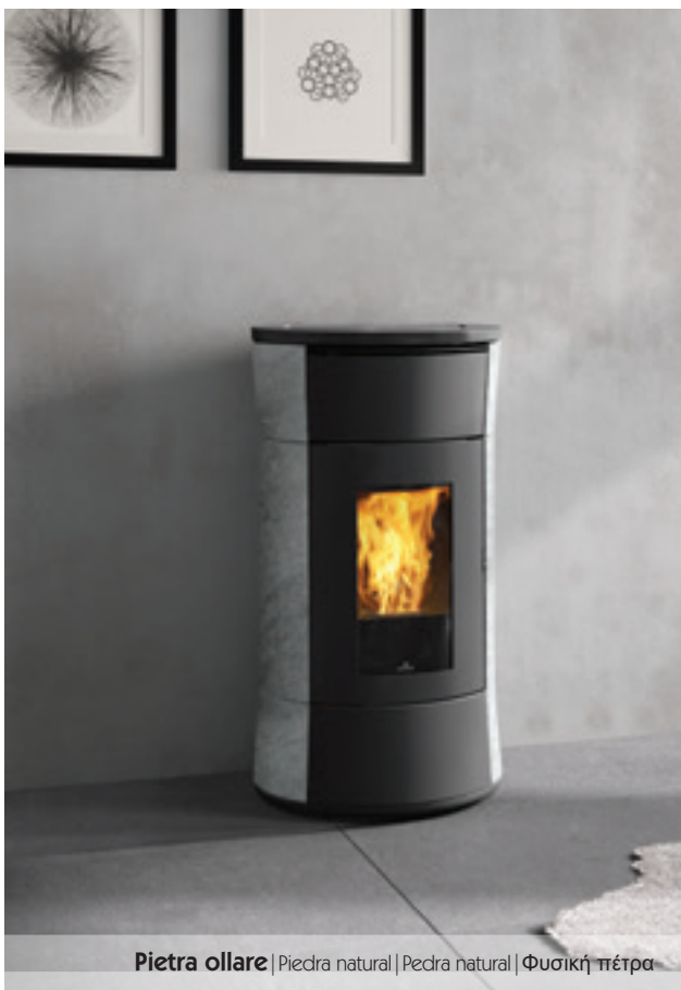
Pietra ollare | Piedra natural | Pedra natural | Φυσική πέτρα

GR Σόμπες pellet με αεραγωγούς, 2 μοντέλα με διαφορετική ισχύ, με κομψό σχεδιασμό σε σχήμα κλεψύδρας. Κεραμική αντίσταση για γρήγορο άναμμα χαμηλής ενεργειακής κατανάλωσης. Λυχνία αποθέματος pellet. Έξοδος καπνού επάνω στον βασικό εξοπλισμό και πίσω προαιρετικά. Η Cherie 9 Evo με 2 εξόδους ζεστού αέρα και 2 βεντιλατέρ: 1 έξοδος ζεστού αέρα μπροστά και 1 έξοδος με αεραγωγό πίσω για τη θέρμανση ενός επιπλέον χώρου. Η Cherie 11 Evo με 3 εξόδους ζεστού αέρα και 3 βεντιλατέρ: 1 έξοδος ζεστού αέρα μπροστά και 2 έξοδοι με αεραγωγό πίσω για τη θέρμανση δύο επιπλέον χώρων. Δυνατότητα ανεξάρτητης ρύθμισης του εμπρόσθιου βεντιλατέρ και των βεντιλατέρ των καναλιών μέσω του τηλεχειριστηρίου Mind Remote. Σύστημα The Mind με ενσωματωμένο wi-fi και εφαρμογή για απομακρυσμένη διαχείριση μέσω smartphone ή tablet, τηλεχειριστήριο Mind Remote. Σύστημα airKare για μια καλύτερη ποιότητα του αέρα στο σπίτι. Διαθέσιμες σε ασάτι λευκό ματ, μπρονζέ και γκρι σκούρο ή σε κεραμικό λευκό, μπρονζό ή γκρι σκούρο ή σε φυσική πέτρα.