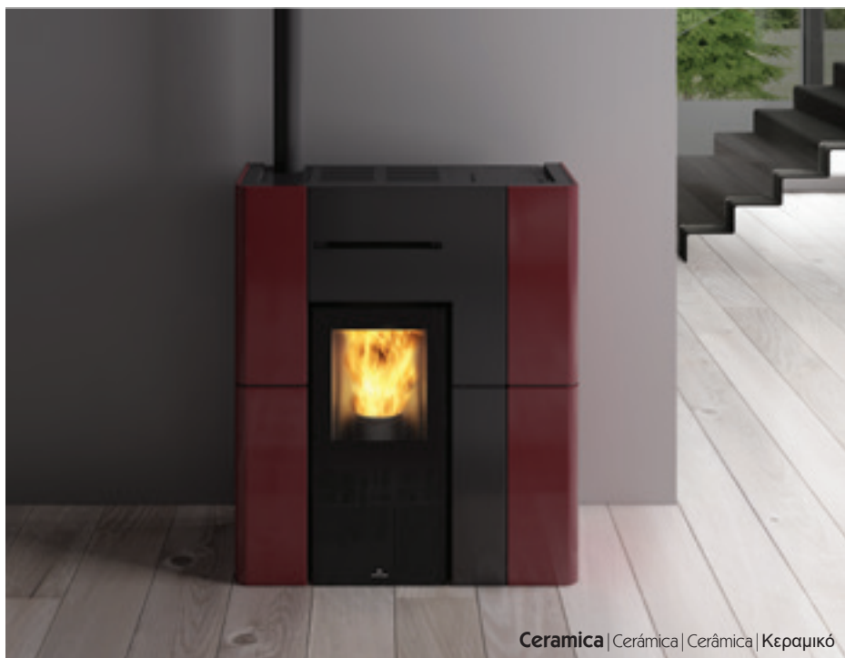
Ceramica | Cerámica | Cerâmica | Κεραμικό

IT Termostufa a pellet “salvaspazio” con soli 36 cm di profondità, dal design lineare. Produce acqua calda per alimentare i termosifoni e i pannelli radianti a pavimento; riscalda l'ambiente con ventilazione aria calda frontale modulabile e disattivabile. Uscita fumi superiore di serie e posteriore optional. Kit idraulico incorporato. Impianto configurabile da display. Candeletta ceramica per una rapida accensione a basso consumo energetico. Sistema The Mind con wi-fi integrato e App per gestione da smartphone o tablet. Spia riserva pellet. Disponibile in ceramica bordeaux, bianco opaco e beige; in acciaio nero, bianco opaco e bronzo; in acciaio nero con inserto centrale frontale in vetro nero.