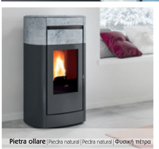
Pietra ollare | Piedra natural | Pedra natural | Φυσική πέτρα