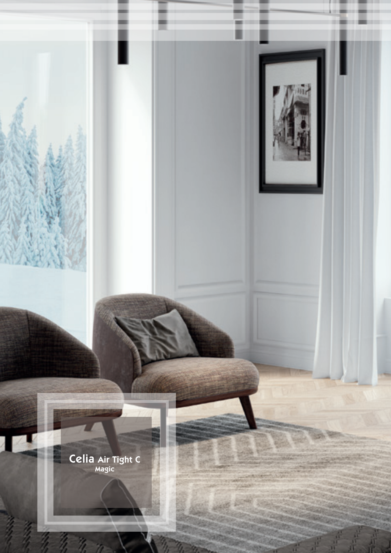
Celia Air Tight C Magic